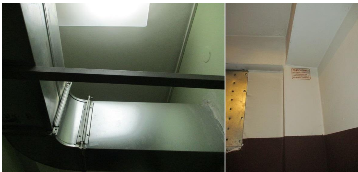
вентилациони систем и обавештење о аудио-видео надзору просторија за задржавање ПС Рума

У просторијама и даље нема система за позивање са службеницима. Међутим, просторија се и видео и звучно надзире, што омогућава задржаним лицима да позову полицијске службенике.