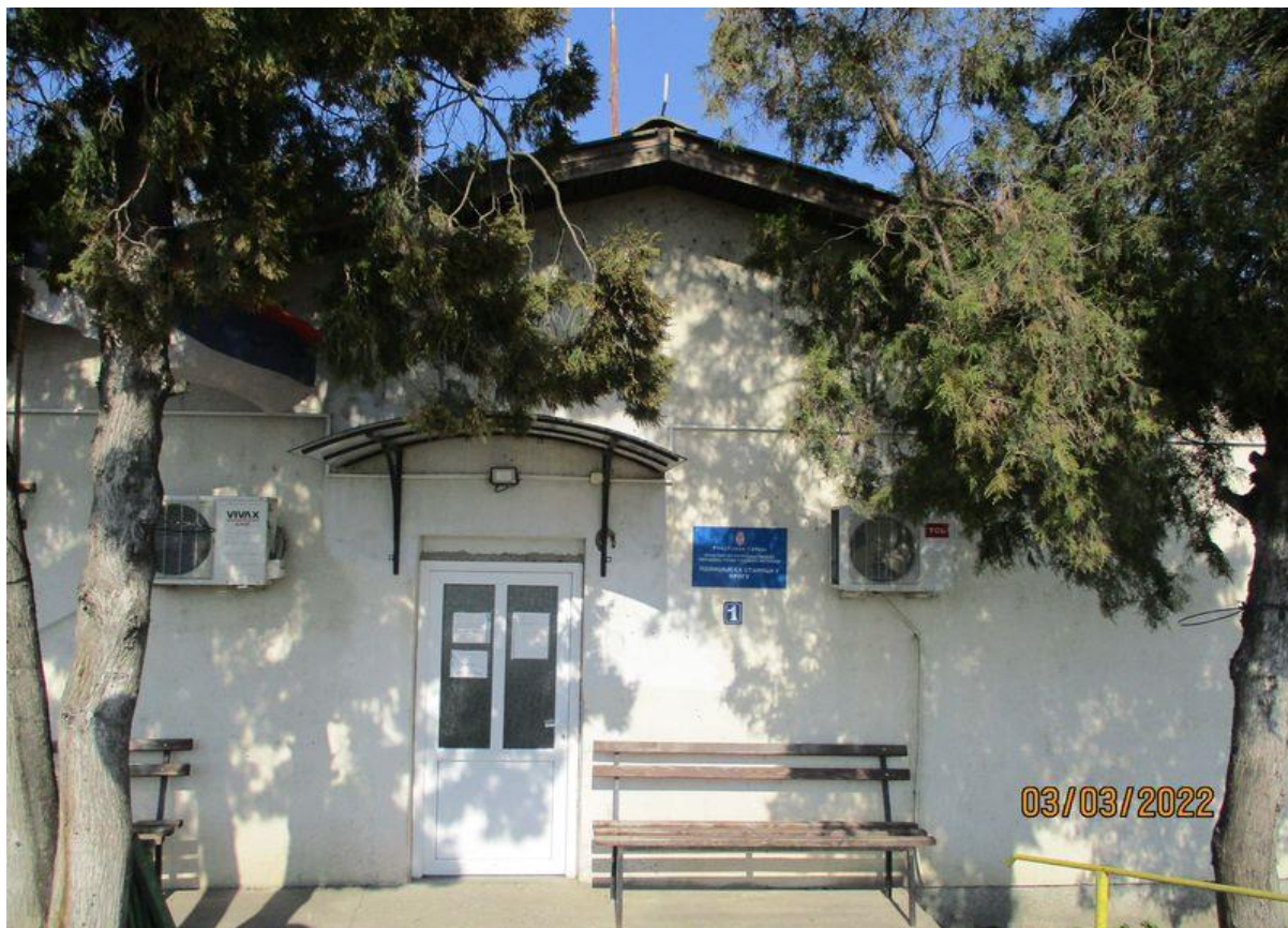
ПС Ириг – фотографија из претходне посете

Током ових посета НПМ је пратио начин на који је у ПУ Сремска Митровица поступиено по упућеним препорукама и у овом Извештају су представљени налази до којих је НПМ дошао, као и налази о другим значајним питањима у вези са поступањем према задржаним лицима.