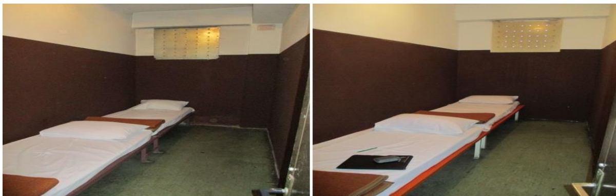
просторије за задржавање ПС Рума

У обе просторије за задржавање у ПС Рума метална заштитна плоча на прозорима онемогућава довољан доток природне светлости, али је, са друге стране, вештачко осветљење одговарајуће јачине па су просторије довољно осветљене. Такође, вентилациони систем омогућава проветравање просторија.