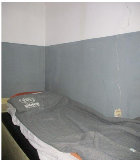
просторија за задржавање ПС Шид

Просторија у ПС Шид нема могућност директног дотока природног светла будући да нема спољни прозор, а вештачко осветљење је одговарајуће јачине. Такође, у просторији је постављено грејно тело – радијатор, које је заштићено плочама у циљу спречавања самоповређивања задржаних лица.