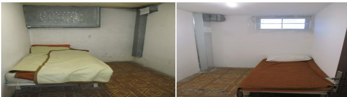
просторије за задржавање ПС Пећинци

ПС Пећинци има две просторије за задржавање и обе имају спољне прозоре. У једној просторији доток природног светла је одговарајући, а у другој метална заштита га скоро у потпуности онемогућава. Са друге стране, вештачко осветљење у обе просторије је одговарајуће па су просторије довољно осветљене.