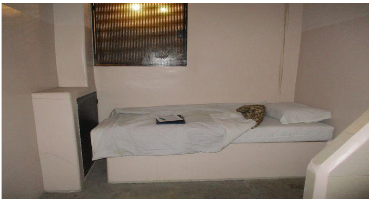
просторија за задржавање седиште ПУ Сремска Митровица

НПМ је и приликом ове посета констатовао недовољно осветљење у просторији за задржавање у седишту ПУ Сремска Митровица. Заштита на прозору онемогућава доток природне светлости, а вештачко осветљење је недовољне јачине.