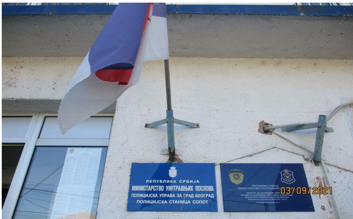
ПС Сопот – фотографија из претходне посете

Током ових посета НПМ је пратио начин на који је поступљено по упућеним препорукама и у овом Извештају су представљени налази до којих је НПМ дошао.