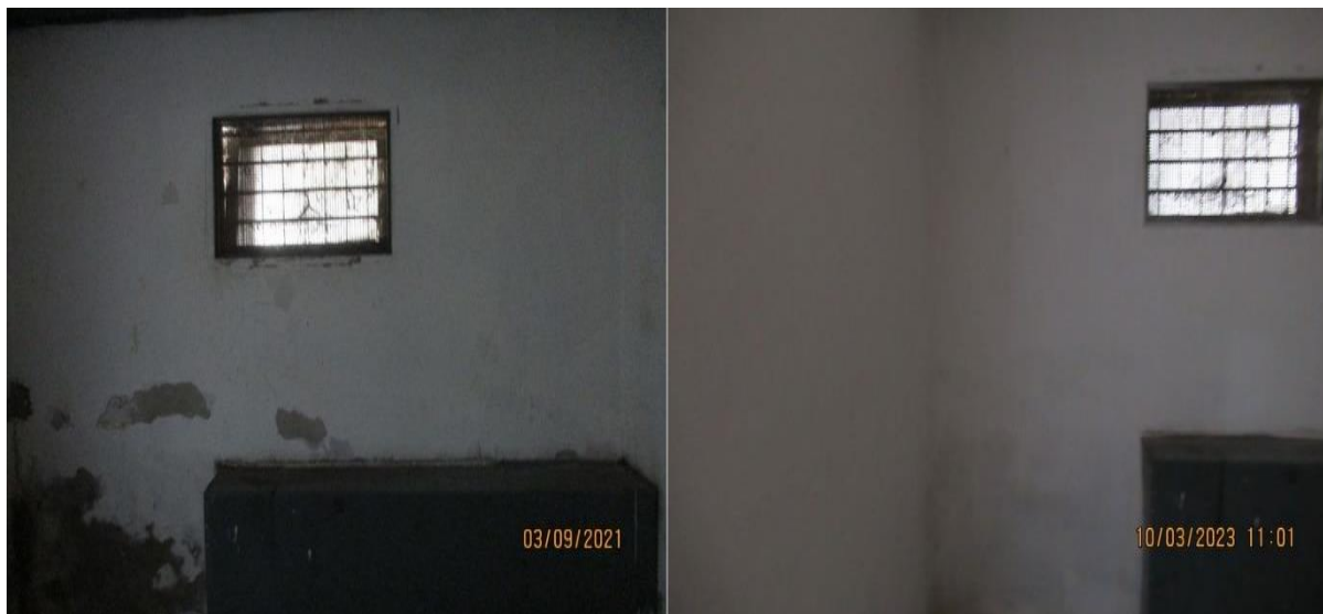
једна од просторија за задржавање у ПС Младеновац – фотографија из претходне (лево) и из ове посете (десно)

Обе просторије за задржавање у ПС Младеновац су окречене, па просторије делују знатно чистије и уредније у односу на претходну посету НПМ.