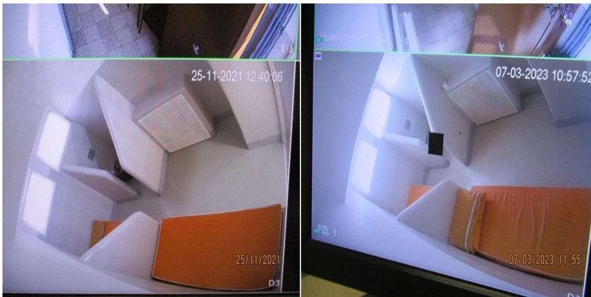
видео надзор над просторијом за задржавање капацитета за 2 лица у ПС Барајево – фотографија из претходне (лево) и из ове посете (десно)