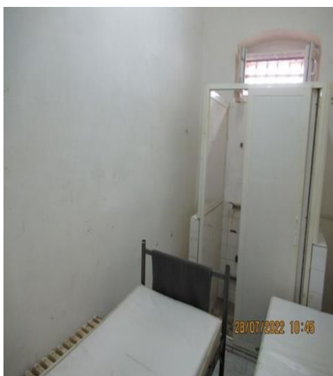
просторија за задржавање у ОЗ Чачак

Свим задржаним лицима је доступна вода за пиће и обезбеђена исхрана. Први оброк задржаним лицима се обезбеђује након 6 сати, а уколико се задржавају дуже од 12 сати обезбеђују им се три obroка дневно. У свим записницима о задржавању лица у које је мониторинг тим НПМ извршио увид затечени су подаци о томе да је лицу понуђен оброк, односно да је обедовало или да је одбило понуђени оброк.