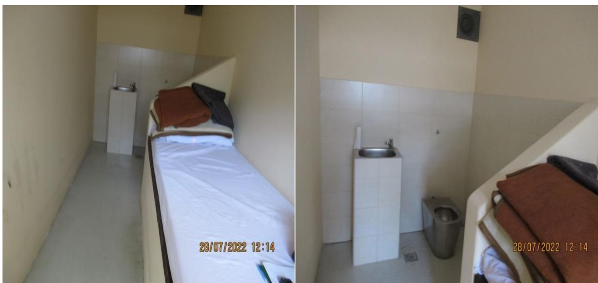
просторија за задржавање у седишту ПУ Чачак

У седишту ПУ Чачак постоје две просторије за задржавање, намењене за по једно задржано лице које су реновиране 2019. године. Просторије су површине по 8.2 m 2 , укључујући и мокри чвор. Затечене су у уредном стању у погледу хигијене. У просторијама је доток природне светлости слаб, а вештачко осветљење је задовољавајуће. Дугме за позивање полицијских службеника је у функцији. Лежајеви су опремљени комплетном постељином. Обе просторије су под видео надзором, који не покрива мокри чвор, а обавештење о видео надзору је видно истакнуто. Надзор се обавља на монитору који је смештен у просторији дежурне службе, али као што је наведено, поред тога, полицијски службеници често обилазе задржана лица.