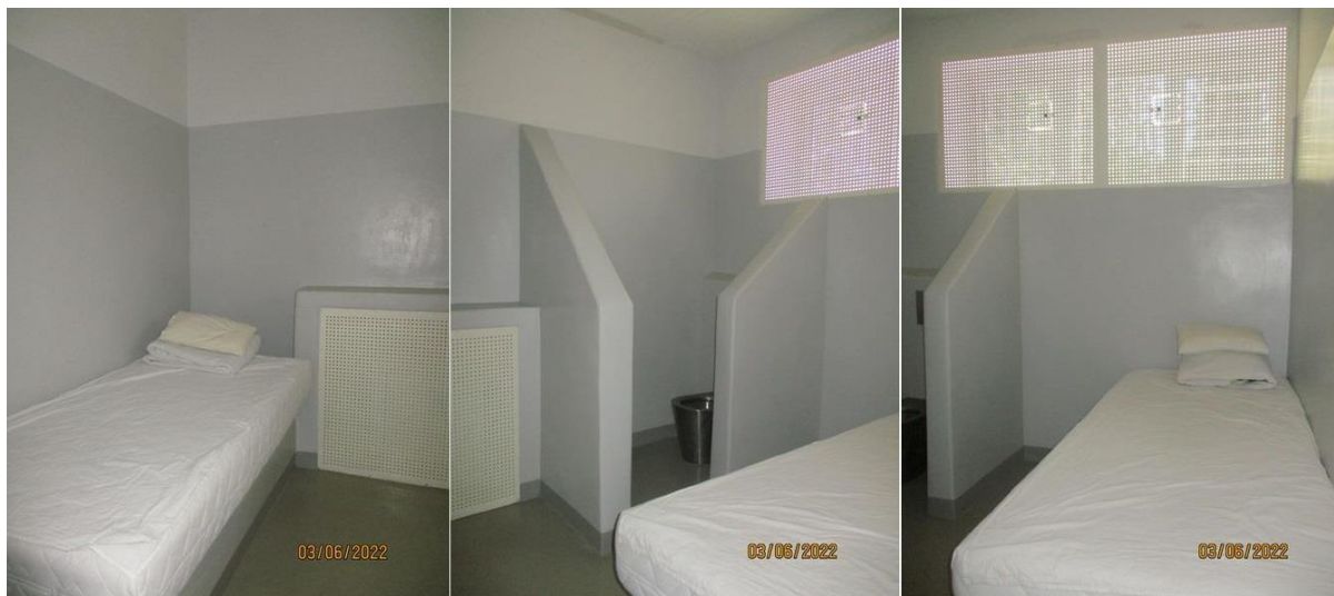
Просторија за задржавање у ПС Ковин

у дежурној служби, се налазе ормарићи за чување привремено одузетих ствари задржаних лица.