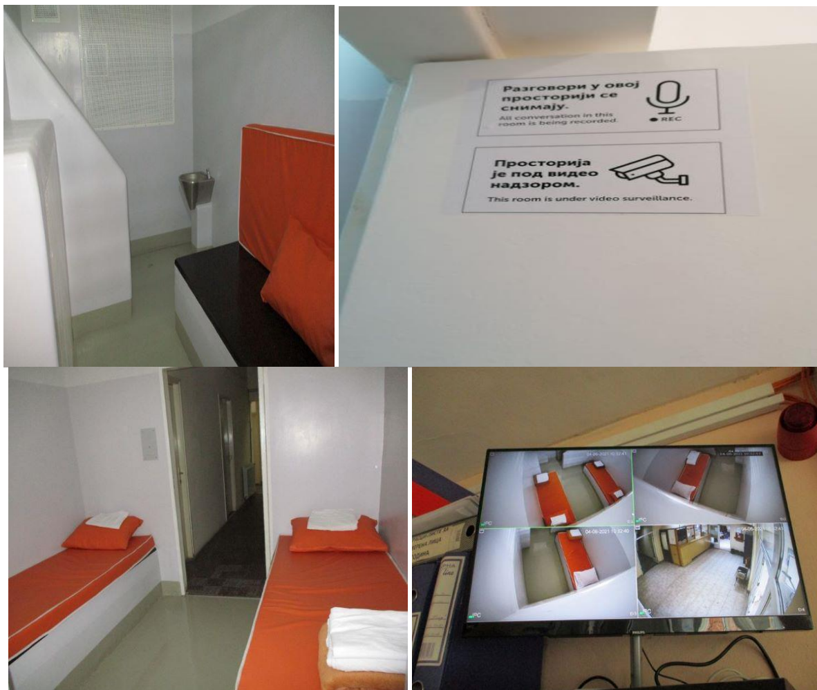
Просторије за задржавање у ПИ Медијана, ПИ Палилула и СПИ Ниш

У ПС Меровина, просторија за задржавање се налази у подруму зграде, има један лежај који је опремљен чистом постељином. У просторији не постоји мокри чвор већ се лице по потреби одводи у тоалет полицијске станице. Иако је прозор у просторији мали са решеткама, није загушљиво, али природног осветљења практично нема, а вештачко осветљење је слабо. Грејно тело је обезбеђено, али нема тастера за позивање полицијских службеника, због чега задржана лица, како наводе, обилазе на сваких сат времена, као и да лице надзиру путем видео надзора, а навели су и да се чује лупање о врата. Према наводима полицијских службеника ПС Меровина урађен елаборат за нову просторију за задржавање.