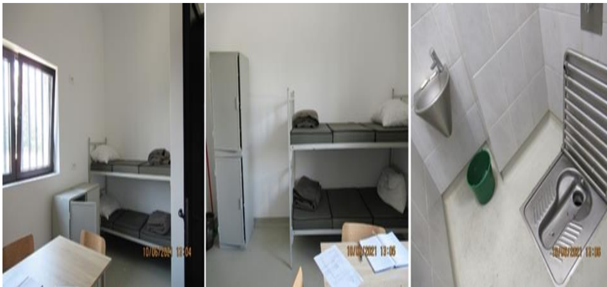
Спаваоница Павиљон Б

Свако одељење има по 12 спаваоница са по 4 кревета и по једну спаваоницу са по 1 креветом. Тренутно на првом спрату у два одељења има по 40 осуђених. Четворокреветне собе имају купатила, димензија су 4 x 5,24 m (око 21 m 2 ), висина 3,5 m (око 73 m 3 ). Једнокреветне спаваонице су димензија 3,04 x 3,80 m (око 11,5 m 2 ) и такође имају купатила.