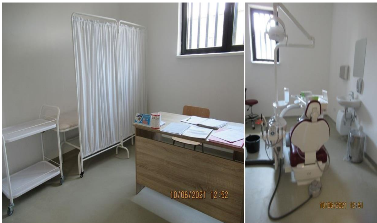
Амбуланта и стоматолошка ординација Павиљон Б

У приземљу Павиљона се налази медицински блок. У једном делу се налазе 4 просторије које нису опремљене, али су предвиђене за лекарске собе, апотеку и лабораторију. У другом делу се налазе ординације: опремљена стоматолошка ординација и амбуланта која је делимично опремљена опремом за општу праксу: ЕКГ, негатоскоп, лампе, пулсни оксиметар и боце за кисеоник. У трећем, стационарном делу су три спаваонице. Једна је прилагођена потребама особа са инвалидитетом са два лежаја, друга је трокреветна, а трећа петокреветна. Све спаваонице су са купатилом.