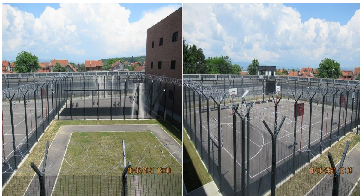
Простори за боравак на свежем ваздуху Павиљон Б

У оквиру овог објекта се налазе три простора за спортске активности и шетњу, који су међусобно одвојени оградном жицом. Један је терен за кошарку, фудбал, одбојку и рукомет. Други простор је теретана која није опремљена свим справама, али се опремање очекује ускоро, а један део је и наткривен. Трећи простор је шеталиште – стаза са зеленом површином у средини. Осуђеницима је омогућено да бораве на свежем ваздуху два сата дневно.